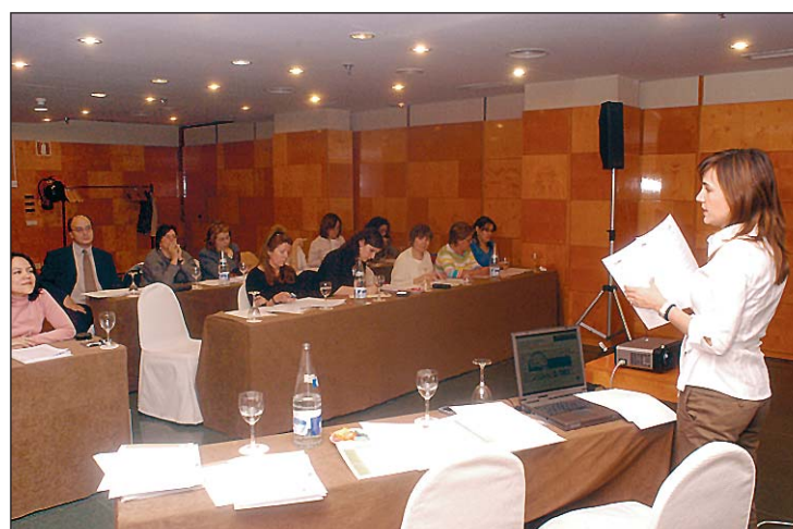
Representantes de asociaciones de pacientes durante la celebración del cuarto taller de formación.

Y es que esta alianza quiere ser un referente en la promoción de la participación del tercer sector. Así, facilitará cauces para que sus opiniones como usuarios del sistema lleguen a los agentes decisores, estableciendo vías de diálogo entre las partes interesadas, de modo que las organizaciones de pacientes puedan convertirse en un apoyo para las administraciones y los profesionales sanitarios y, al mismo tiempo, proporcionarles las garantías necesarias, a través de la promoción de su gestión basada en los criterios de calidad y responsabilidad social. La plataforma tiene previsto la organización de