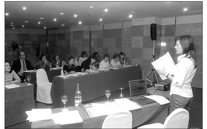
Representantes de asociaciones de pacientes durante la celebración del cuarto taller de formación de Fundamed.