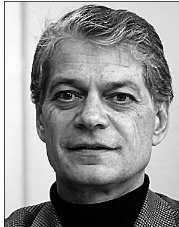
Alberto Infante, director gral. de la Agencia de Calidad del SNS.

Otro de los datos significativos del estudio Eneas ha sido que la incidencia de fallecimientos en los sujetos que presentaron efectos adversos fue del 4,4 por ciento, una de las cifras más bajas de todos los estudios realizados hasta el momento en otros países, lo que